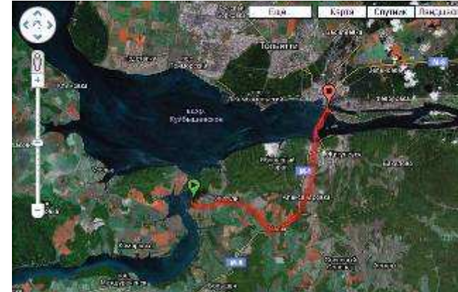
г.Тольятти – 30км