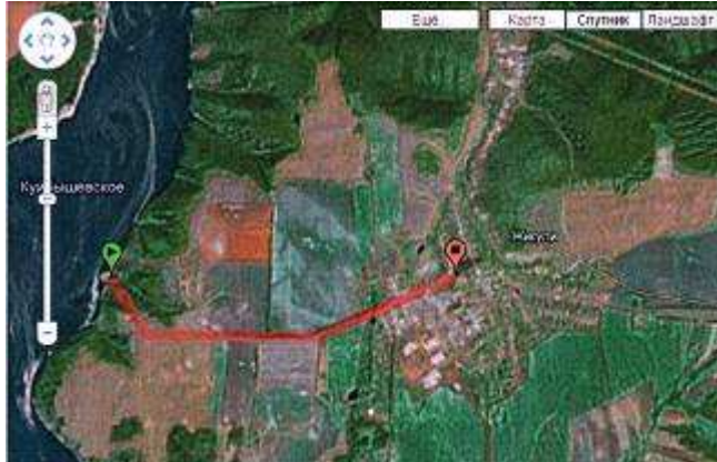
с.Жигули – 4км