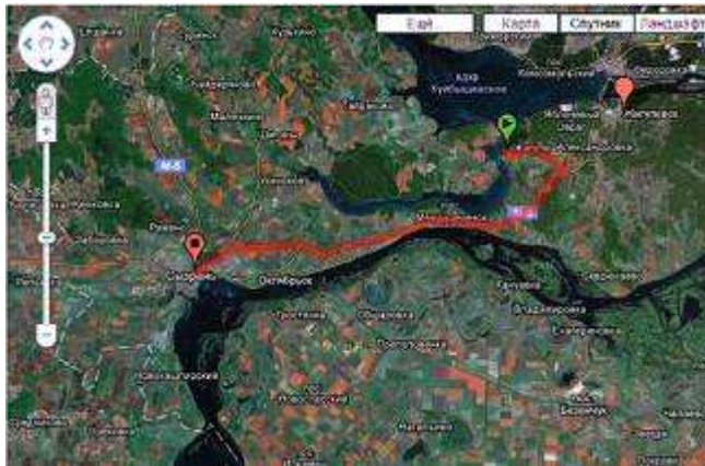
г.Сызрань – 80км